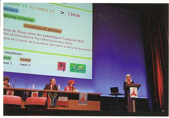
2008年10月、第11回 おもちゃの図書館国際会議がフランスの パリで開催。