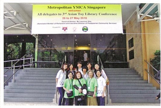
2010年5月、第3回おも ちゃの図書館アジア会議がシンガポ ールで開催。