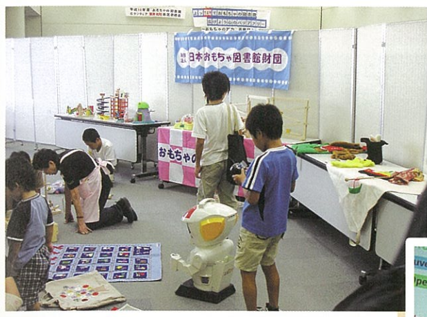
2007年、全国ボランティアフェスティバル あいち・なごや大会。 会場で楽しむ子どもたち。